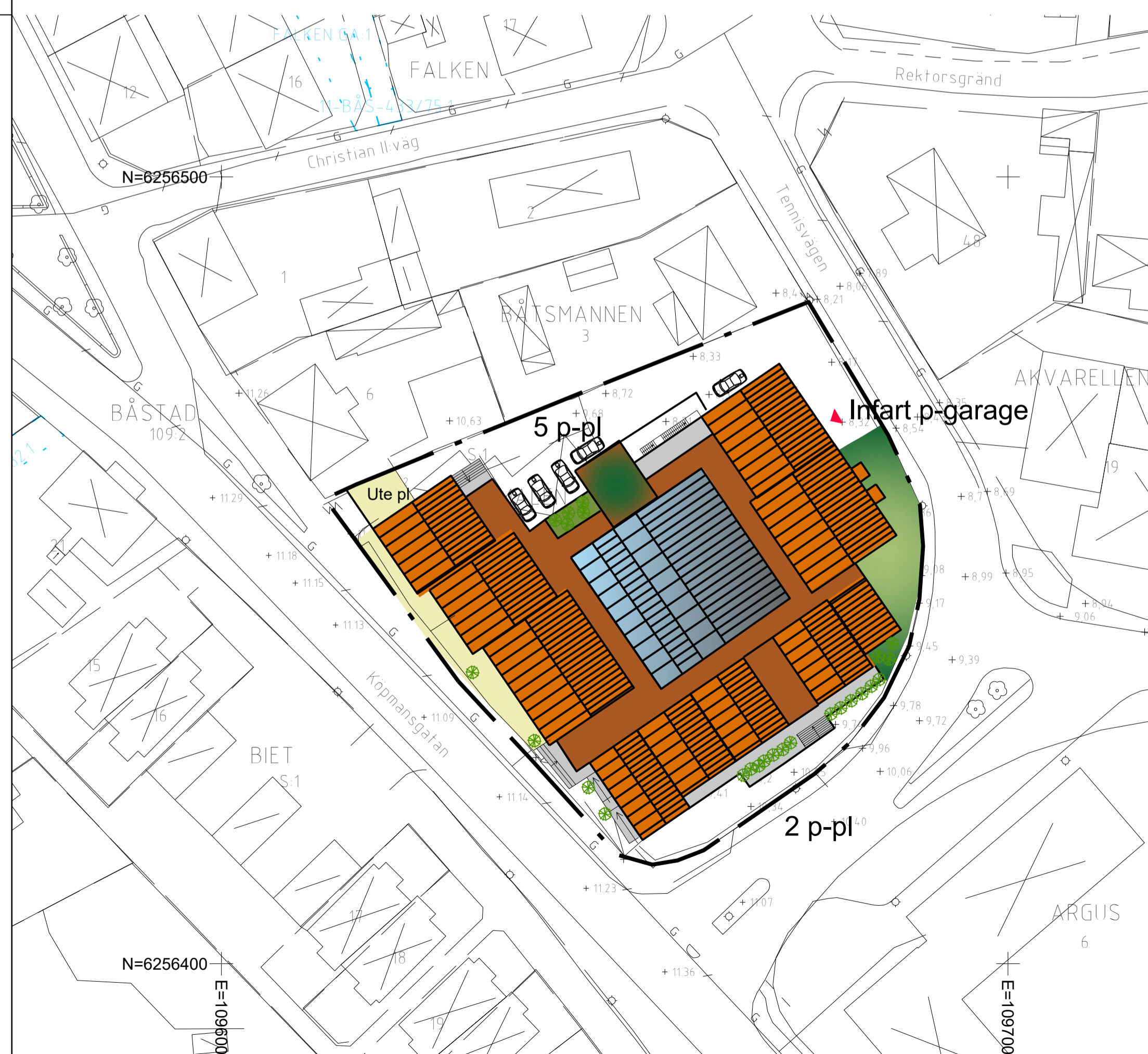
ILLUSTRATIONSKARTA Skala: 1:500 (A1) 1:1000 (A3)