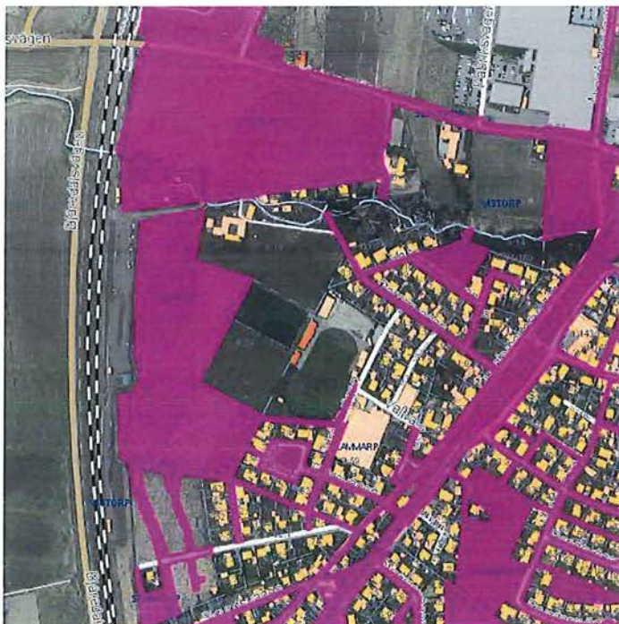
Bild: Kommunens markinnehav markerat i rosa

Området är strategiskt lokaliserat strax söder om Förslövs station. Det är viktigt att kommunen planerar sitt markinnehav på ett effektivt sätt så att så många intressen som möjligt tillvaratas.