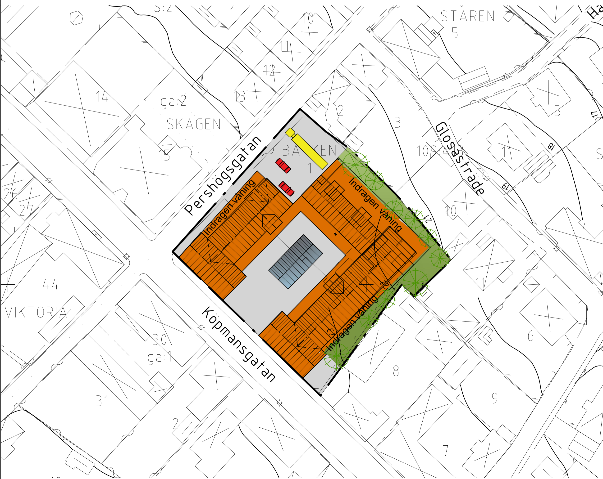
ILLUSTRATIONSKARTA Skala: 1:500 (A1) 1:1000 (A3)