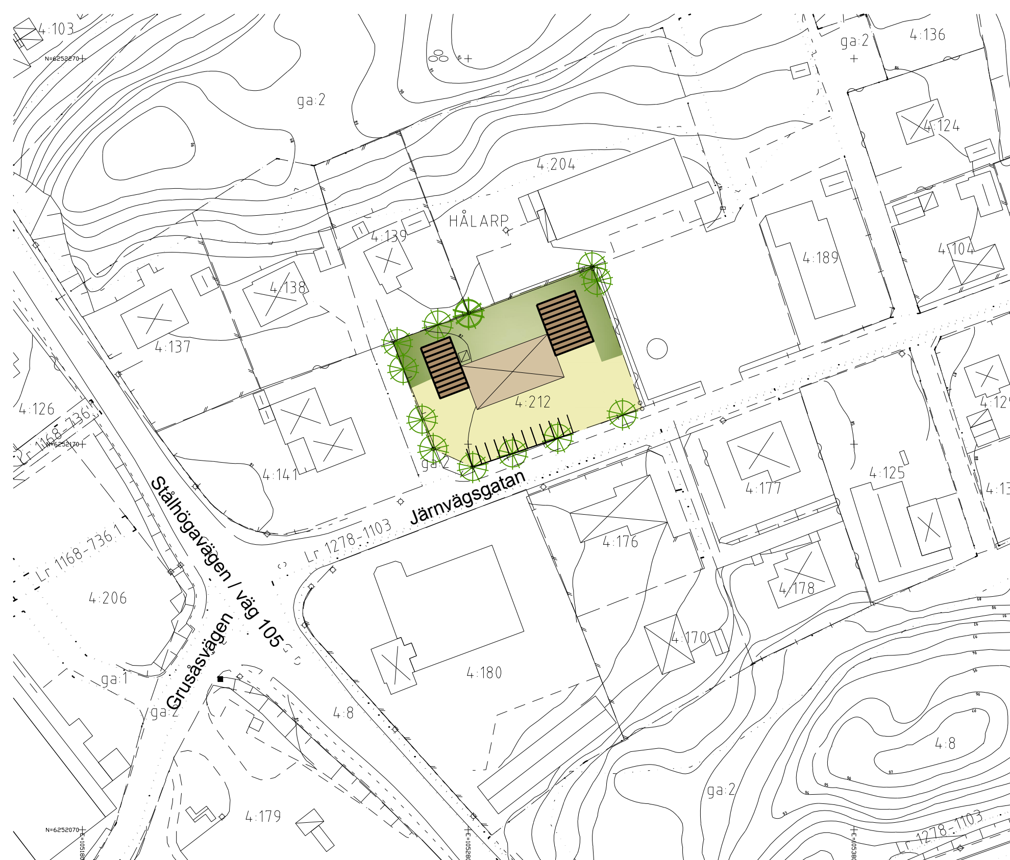
ILLUSTRATIONSKARTA Skala: 1:1000 (A1), 1:2000 (A3)