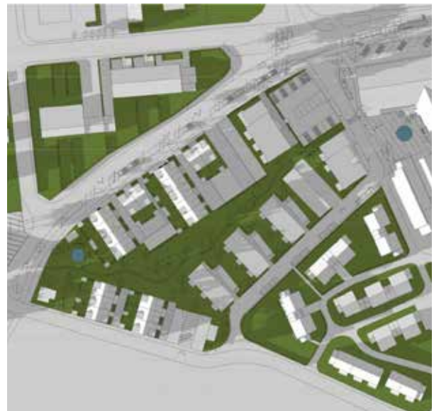
Vårdagjämningen kl. 18:00