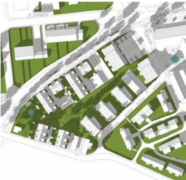
Vårdagjämningen kl. 15:00