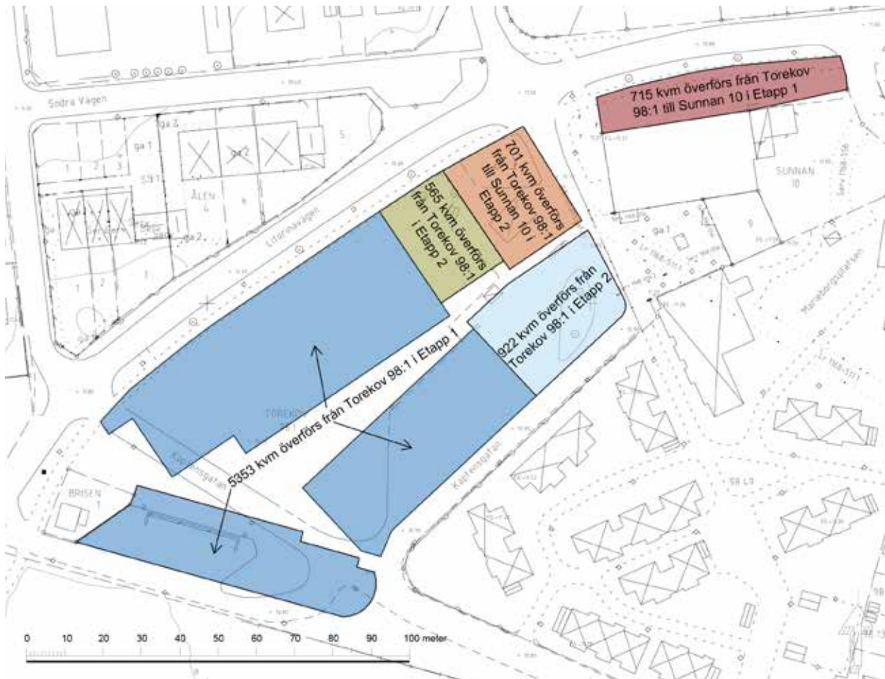
Fastighetsregleringar inom planområdet