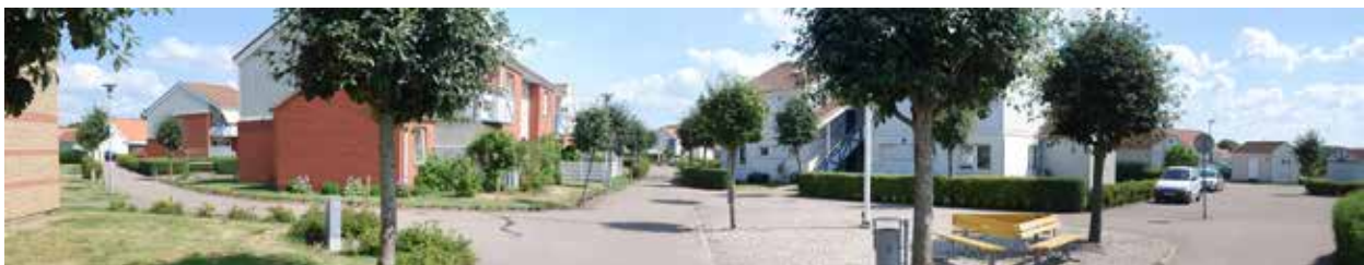
Bostadsområde öster om planområdet

Befintlig bebyggelse i området består av flerbostadshus och villor. Bebyggelsen är uppförd i två till tre våningar med tegel-, trä- och putsfasader. Flertalet uppfördes under 1970- och 80-talet, bebyggelsen norr om planområdet uppfördes omkring år 2000.