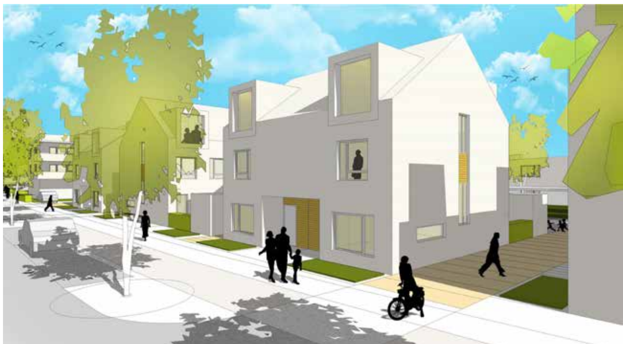
Utformning mot Litorinavägen med gång- och cykelbana i anslutning (Jais Arkitekter)