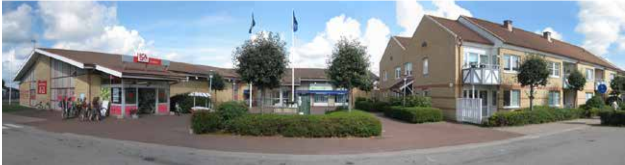
Torget med ICA-butik, mäklare och servicehem