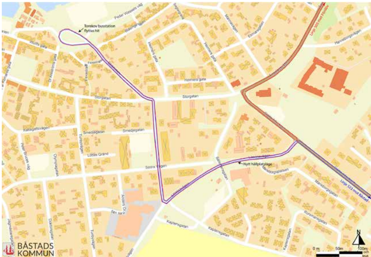
Föreslagna linjestreckningar för buss 505 och 523