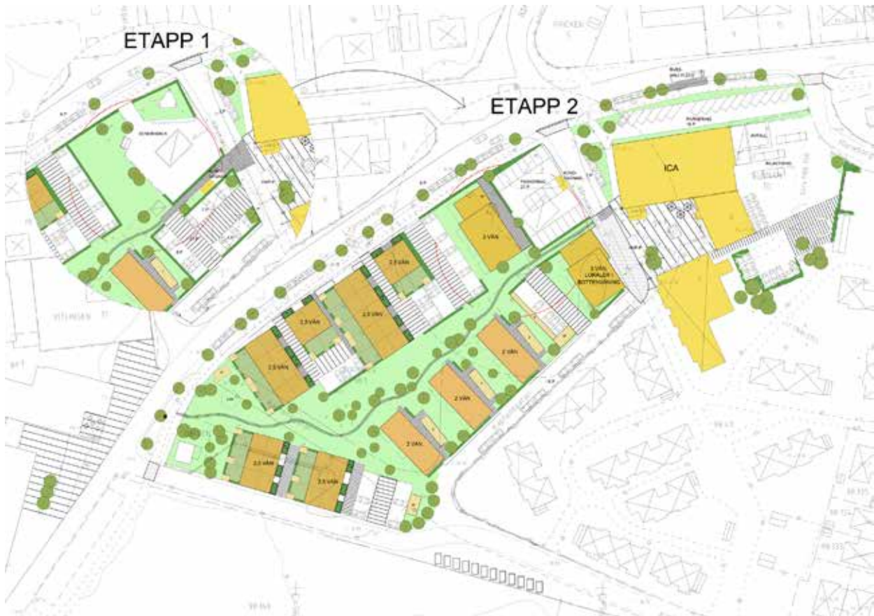
Illustration av planförslaget (Jais Arkitekter)

Byggnadernas placeringar är anpassade efter de funktioner som planområdet ska fylla. Befintliga förutsättningar utgörs av torget i öster och fabriken i väster och dessa båda noder ska bindas samman med ett centralt stråk. Bostadsbebyggelsen placeras utefter Litorinavägen, Båtsmansgatan och Kaptensgatan, med undantag av den befintliga infarten som tas bort. Istället kommer vägen söder om nätstationen öppnas upp och utgöra en ny infart för planområdet samt bakomliggande bebyggelse. I illustrationskartan nedan visas hur området kan utformas när det är färdigutbyggt. Cirkeln i hörnet (etapp 1) visar skillnaden i utformningen så länge macken finns kvar.