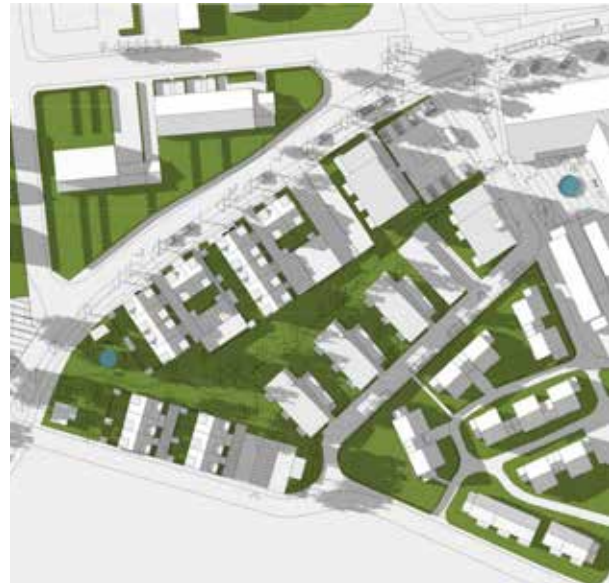
Sommarsolståndet kl. 18:00