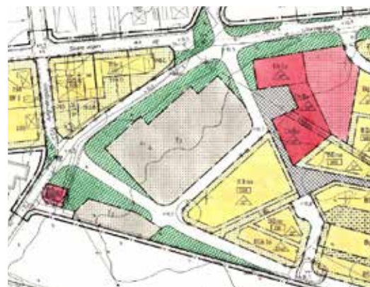
Utsnitt ur detaljplan 1393

För planområdet gäller idag detaljplan 1393 (laga kraft 1982-05-18) och detaljplan 1542 (laga kraft 2001-07-30). Planerna har ingen genomförandetid kvar. Gällande bestämmelser för aktuellt planområde är "Tp" - Parkering, "Ch" - Centrumbebyggelse, "Es" - Transformatorstation, "Park eller plantering" samt "Lokalgata". Centrumbebyggelsen får uppföras i en våning utan källare och taklutningen får max vara 22 grader.