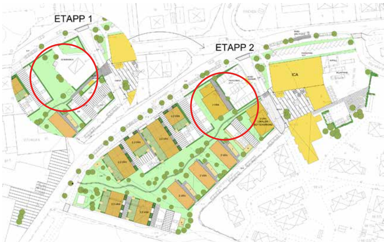
Röd cirkel visar skyddsavståndet för bensinmacken

Avsikten med detaljplanen är att möjliggöra för bostäder i området, men fram tills dess att bensinmacken flyttas kommer det inte vara möjligt att uppföra bostäder inom skyddsavståndet. I detaljplanen villkoras att bygglov för bostäder inom skyddsavståndet inte får ges förrän bensinmacken har flyttas och markens lämplighet för bostadsbebyggelse har säkerställts enligt kraven för känslig markanvändning (KM). I bilden nedan visas hur etapp 1 skiljer sig från etapp 2. Bostäder som planeras inom skyddsavståndet (röd cirkel) blir möjliga att uppföra i etapp 2 när bensinmacken är flyttad.