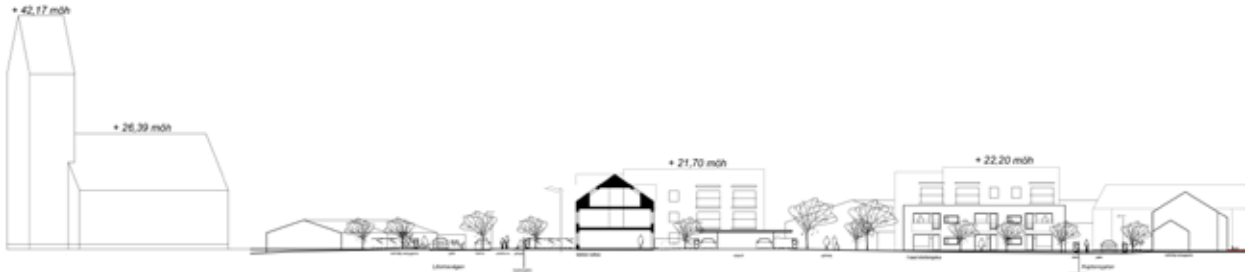
Sektion genom kvarteret från norr till söder med Torekovs kyrka som referens

I nedanstående sektion visas hur hög bebyggelsen maximalt kan bli i etapp 2 i förhållande till befintliga byggnader. Som referens syns även höjden på Torekovs kyrka bredvid. Höjderna anges i antal meter över havet. I detaljplanen regleras höjderna i antal meter över omgivande gator.