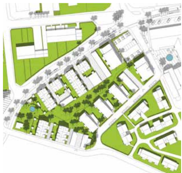
Sommarsolståndet kl. 12:00