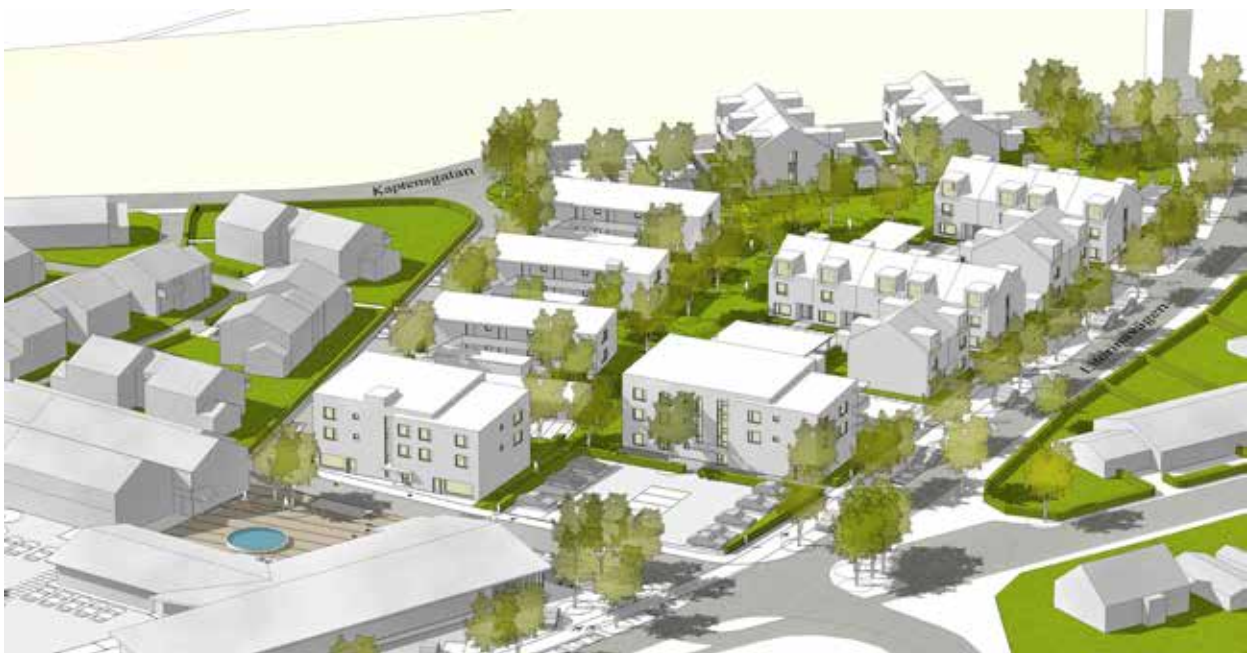
Perspektiv över planförslaget från nordost då planområdet är fullt utbyggt (Jais Arkitekter)

Ambitionen med torget är att det ska utökas för att binda samman befintliga verksamheter med de tillkommande. För att inte hindra renhållningsfordon från att ta sig fram planläggs Båtsmansgatan som lokalgata. Tillgängligheten för personbilar bör dock begränsas vilket kan åstadkommas genom att höja upp gatan till samma nivå som torget.