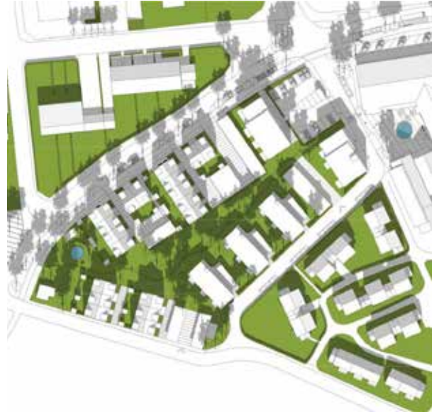
Vårdagjämningen kl. 12:00