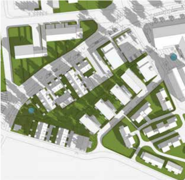
Vårdagjämningen kl. 9:00