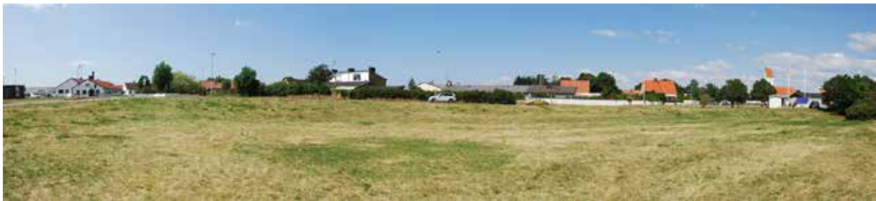
Grönytan, till vänster i bakgrunden syns fabriken

Marken i planområdet utgörs främst av en grönyta som till största delen är planlagd som parkering. Topografiskt är marken inom planområdet belägen ca 11 meter över havet. Planområdet är relativt platt förutom den centrala grönytan som ligger i en sänka ca 2 meter ner. Inga intresseområden vad gäller flora, fauna, nyckelbiotoper eller hotade arter är kända inom området. Planområdet omfattas inte av skydd enligt 7 kap. MB och är inte beläget inom område som bedömts som ekologiskt särskilt känsligt i kommunens översiktsplan eller naturvårdsprogram.