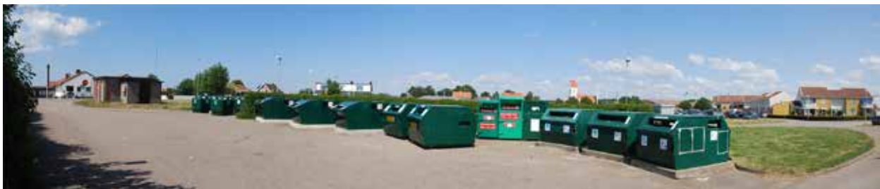
Återvinningsstationen bredvid nätstationen

Planområdet korsas av ett parkstråk längs med Litorinavägen med gång- och cykelbana. I den östra delen av planområdet finns ett torg med bl.a. ICA-butik och bensinmack i anslutning. I den södra delen finns en nätstation och en återvinningsstation.