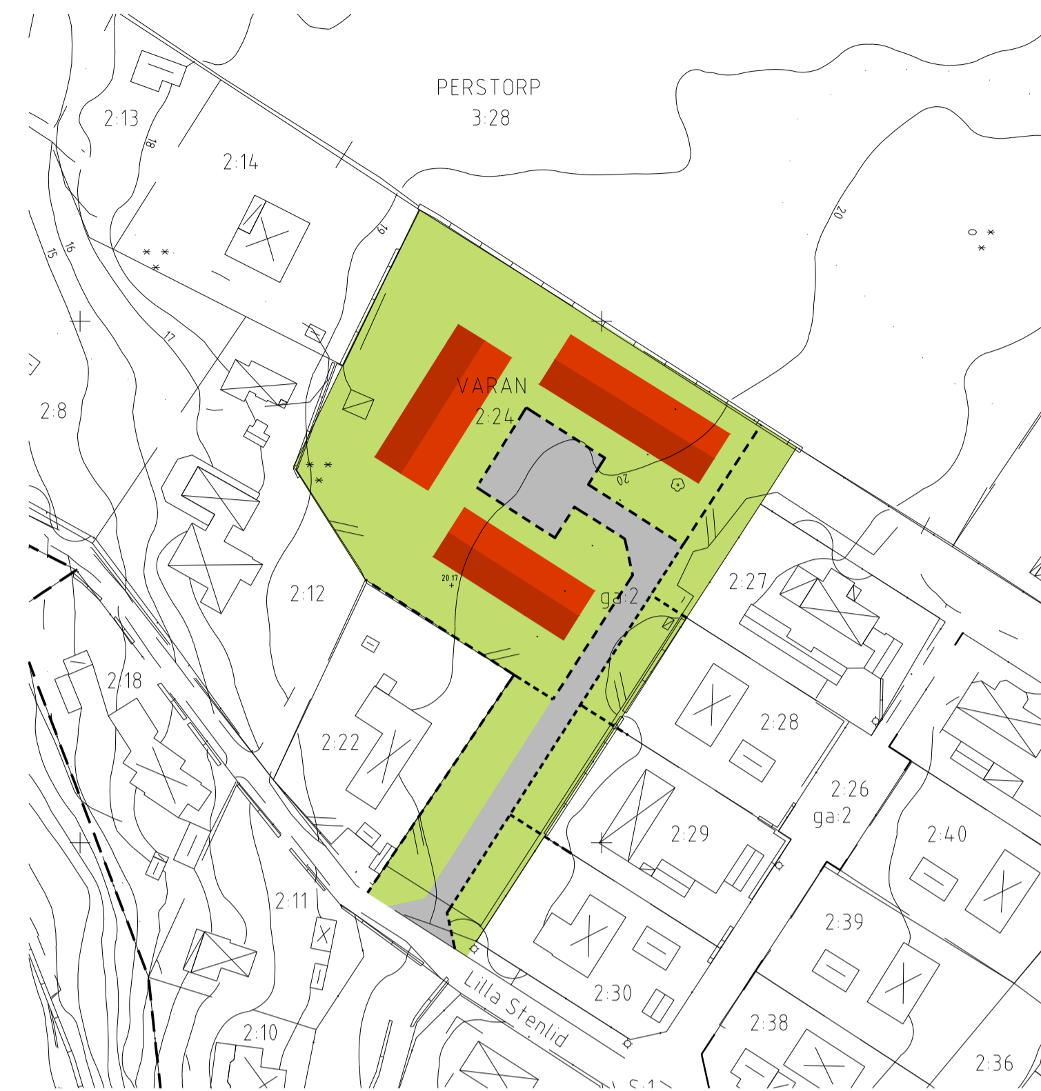
ILLUSTRATION ALTERNATIV BEBYGGELSEUTFORMNING, RADHUS

GRUNDKARTAN Grundkartan är upprättad i april 2018 på grundval av Båstads kommuns primärkarta. Platsbesök utfört jan 2018. Fastighetsredovisningen avser förhållandena i april 2018. Koordinatsystem i plan: SWEREF 99 13 30 Höjdsystem: RH 2000