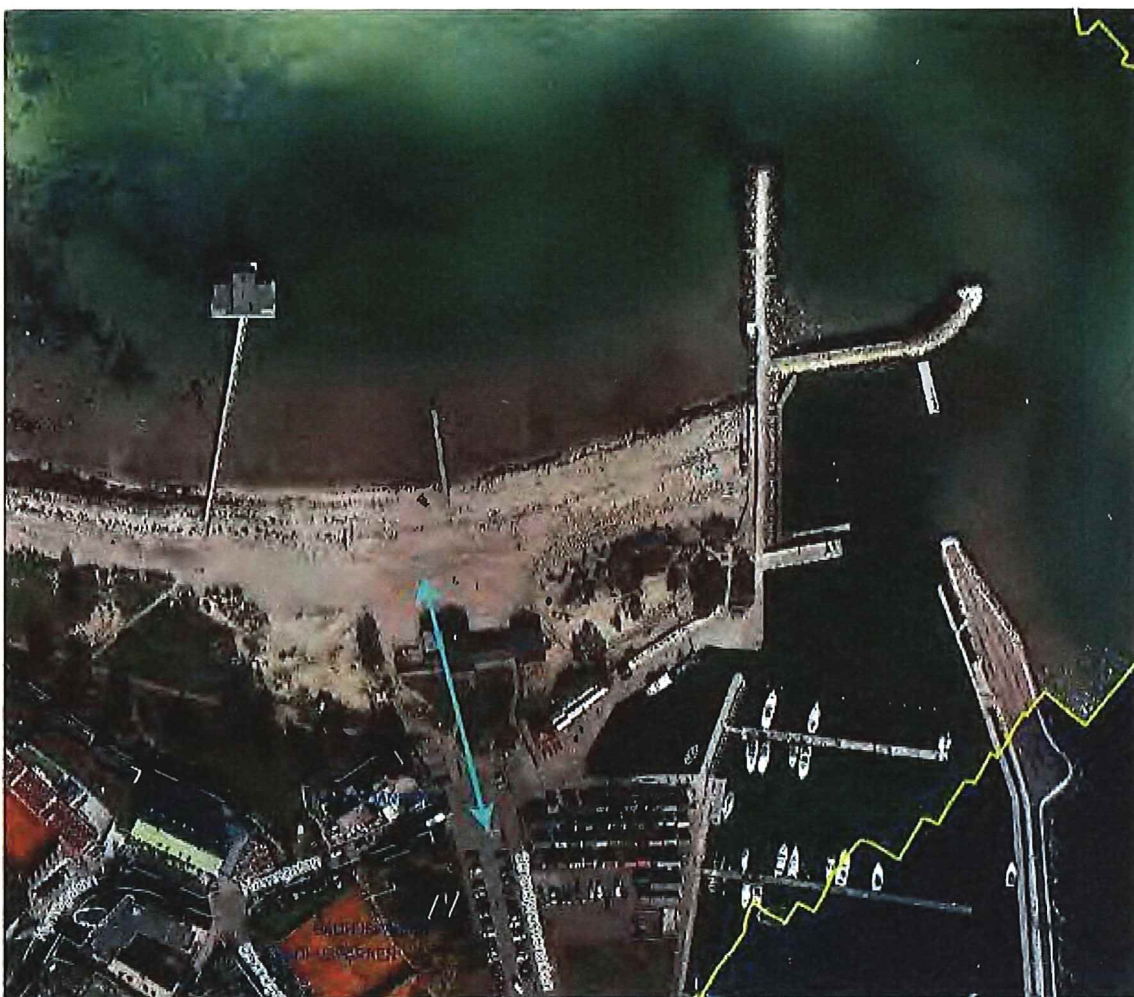
Pilen visar hur siktlinjen från hamnen bryts av byggnaden, en flytt av Badkrukan skulle stärka den visuella kontakten mellan havet och de allmänna ytorna i hamnen.

Planen omfattar kommunägd mark vilket enligt kommunstyrelsens prioriteringsordning innebär att den ska inordnas med prioritet 2 i kommunens prioriteringslista.