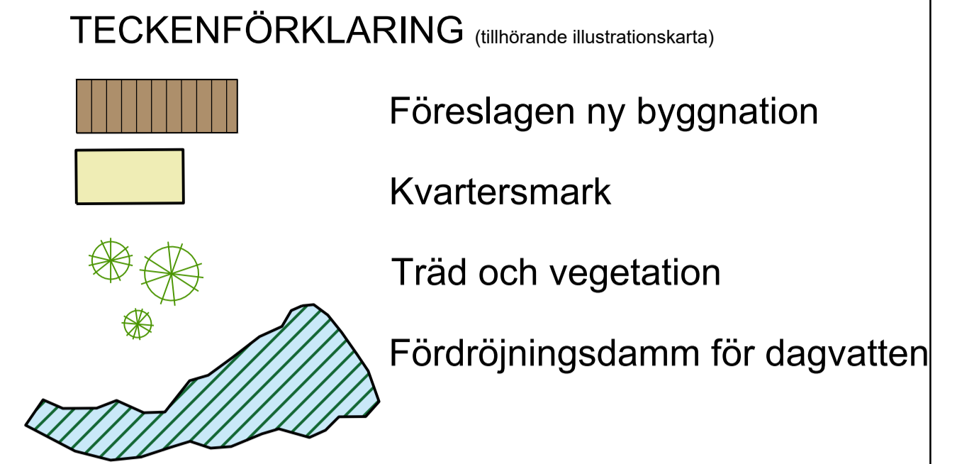
ILLUSTRATIONSKARTA Skala: 1:1000 (A1) 1:2000 (A3)