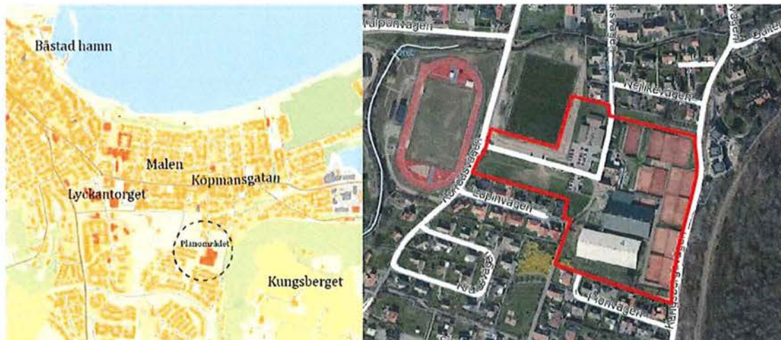
Planområdets läge i Båstad t.v. Ortofoto med planområdet samt omgivande fastigheter t.h. Planområdet är markerat med röd linje

Huvudsyftet med detaljplanen är att se över befintlig byggrätt för att rätta till planavvikelse som gjorts och ge verksamheterna bättre utvecklingsmöjligheter. Planen syftar också till att möjliggöra en utökning av idrottsverksamheten och lokaler för tillfällig vistelse (till exempel vandrarhem och liknande) samt en mer ändamålsenlig parkering. Planområdet är beläget i centrala Båstad, strax söder om centrum och avgränsas av bebyggelsen längs med Lupinvägen och Pionvägen i söder, en konstgräsplan och bebyggelsen längs med Nejlিকেvägen i norr, Kungsbergsvägen i öster samt Korrödsvägen i väster. Planområdet omfattar fastigheterna Nej- likan 3, Nejlukan 4 och stora delar av Nejlukan 2 samt en liten del av Båstad 109:2. Området om- fattar ca 4,2 ha (42 245 m 2 ).